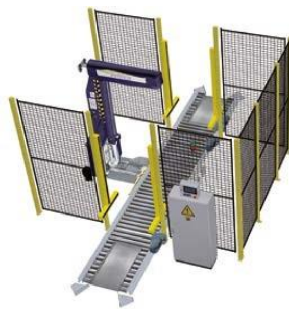
1 Instalación Automática de Aro Giratorio