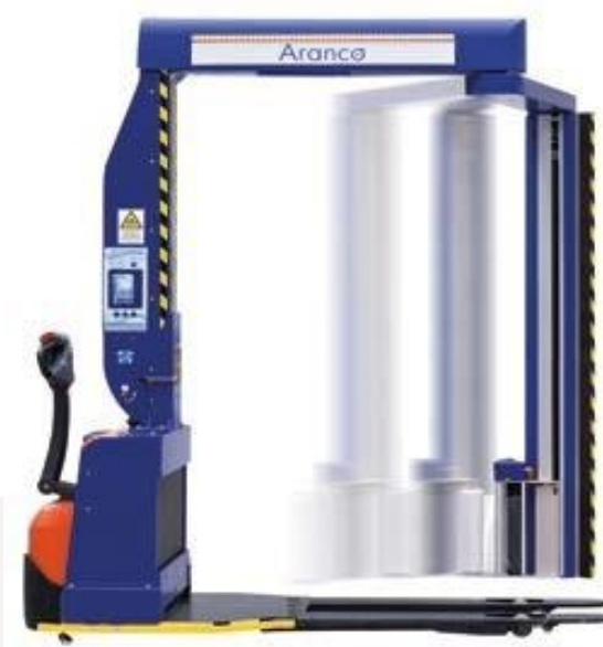
3 Envolvedora Semiautomática ME-2200