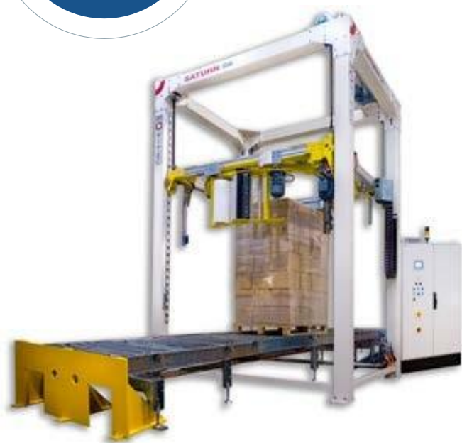
1 Instalación Automática FA-PRO